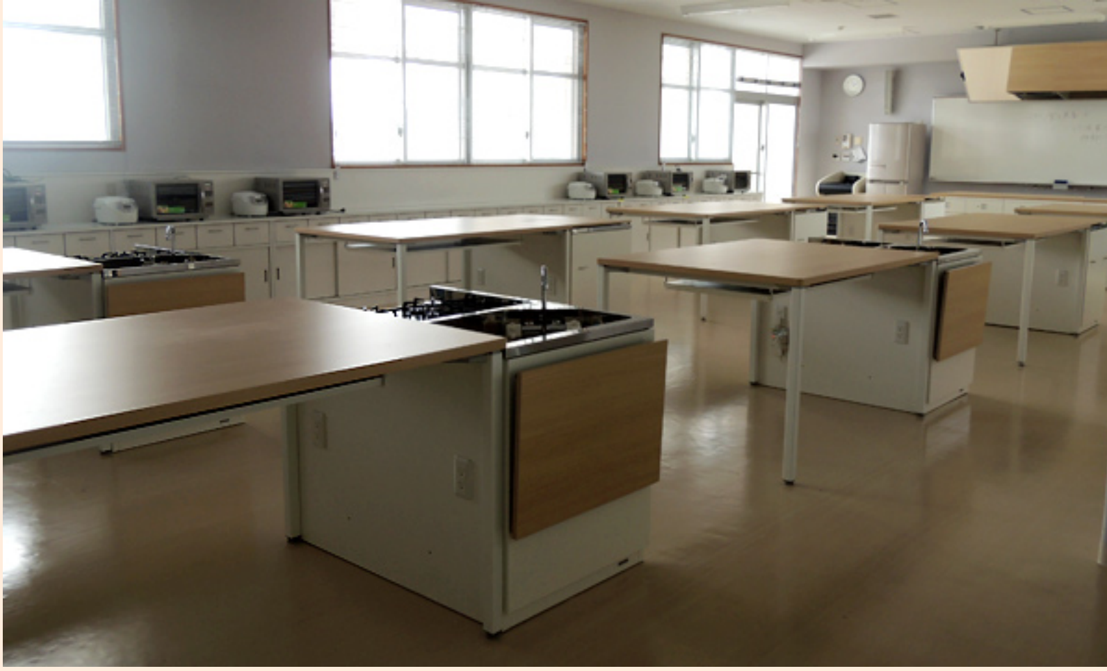
モダンな自習室（写真上）と広くてきれいな調理実習室（下）。調理実習室は小児栄養実習で使われるようです。