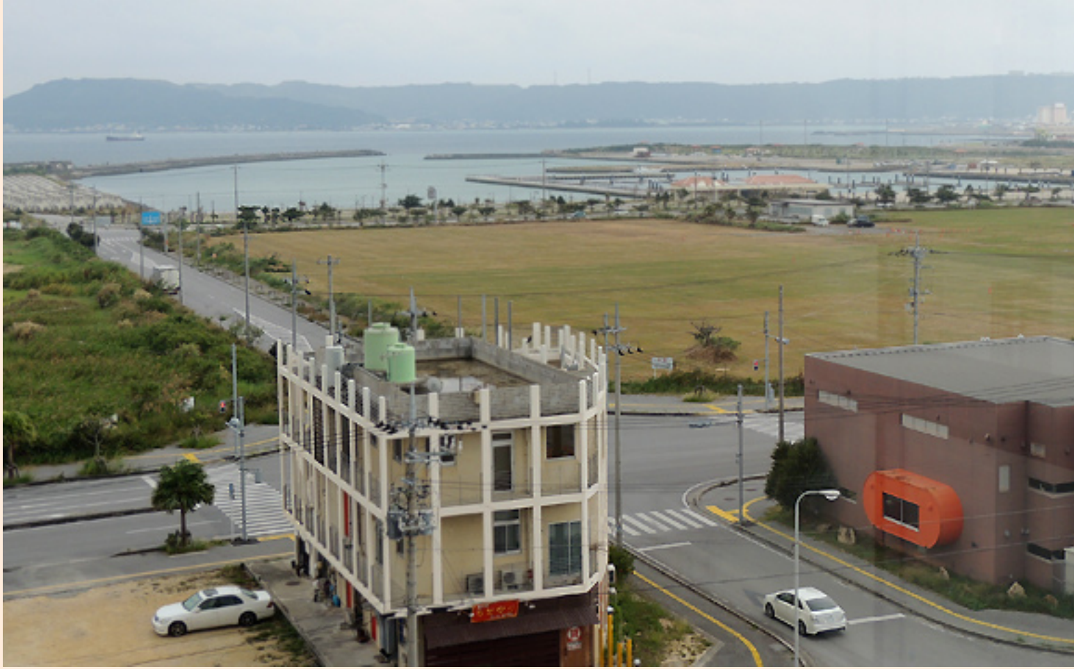
6階から見たグラウンド側の光景（写真上）と海方向の光景（下）

そう、そう、階段の踊り場で見かけたステンドグラスが素敵だったんです。沖女の建学の精神となった白ゆりがほどこされていました。