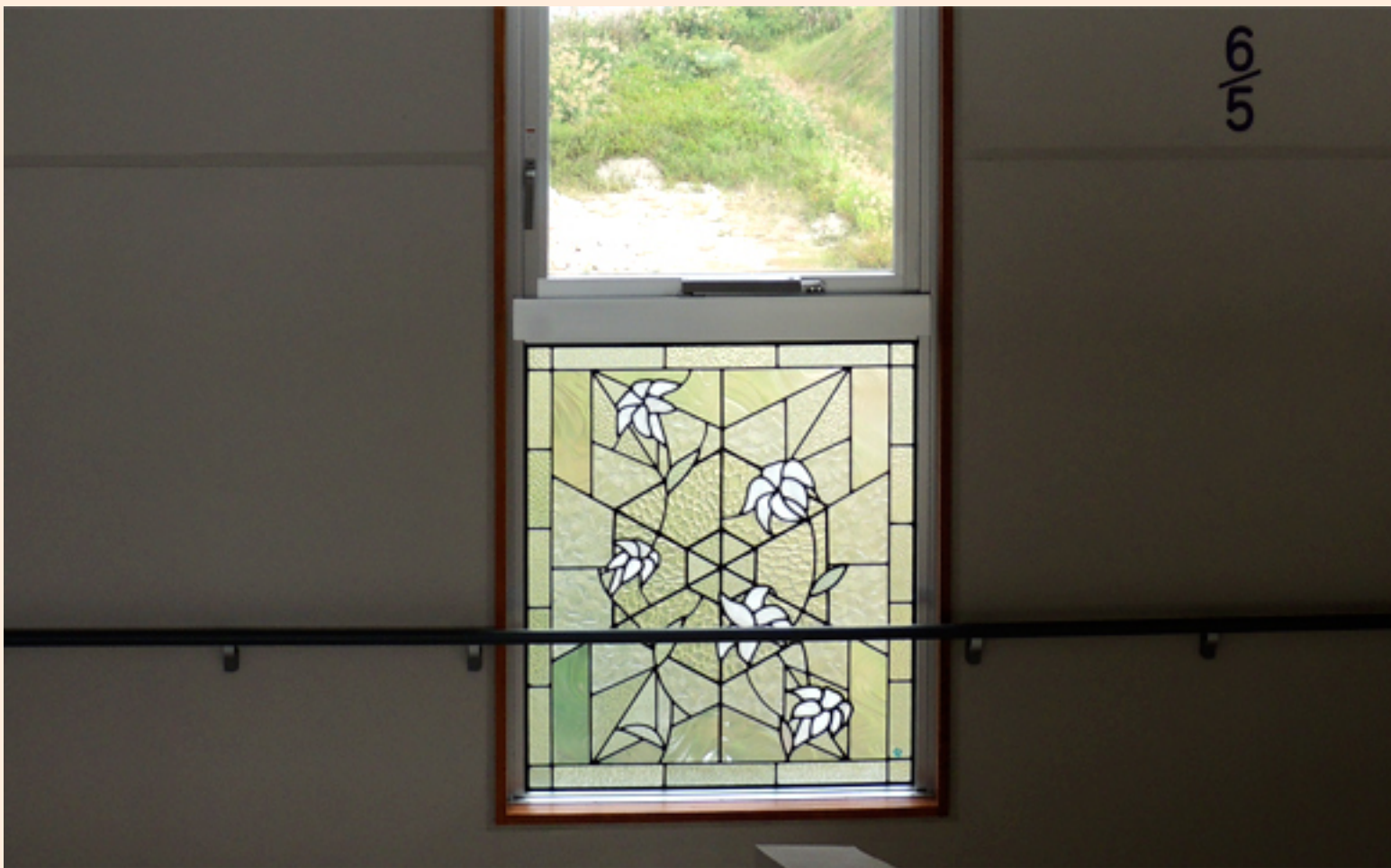
階段の踊り場のステンドグラス

そう、そう、階段の踊り場で見かけたステンドグラスが素敵だったんです。沖女の建学の精神となった白ゆりがほどこされていました。