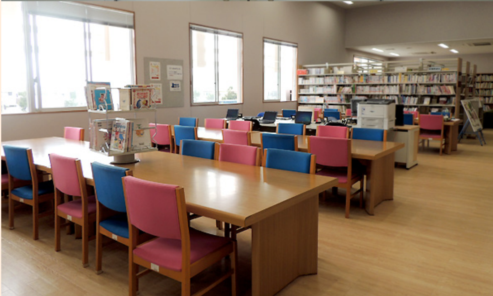
図書館の入口（写真上）と静かで居心地よさそうな閲覧スペース（下）