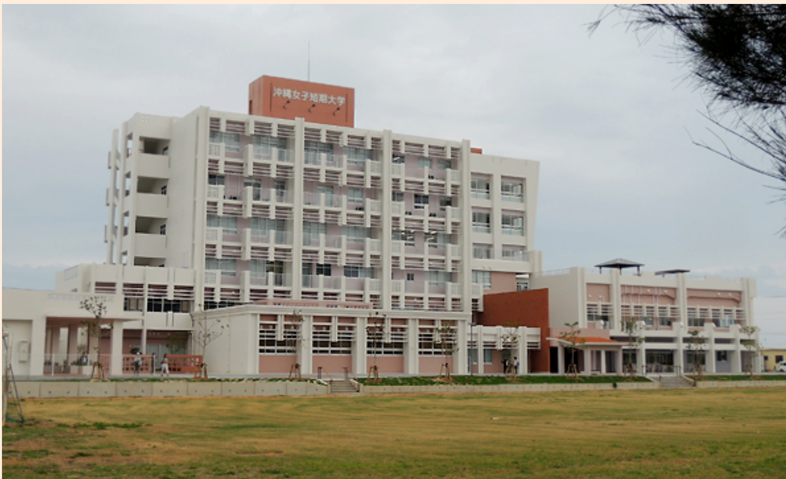
東浜きょうりゅう公園から西原町方向へ進むと見えてくる沖縄女子短期大学

その沖女の移転後初の オープンキャンパス が10月31日に開催されました。 東浜にある「きょうりゅう公園」の先にちらりと見えるきれいな校舎が気になっていたわたしは、ここぞとばかりに取材のお願いをして、 与那原新キャンパス を見学してきましたよ~。^^ ※タイトルは「高校生のふりして」としていますが、もちろん、どうやっても無理なので、そんなことはしておりません。念のため。(^^ゞ