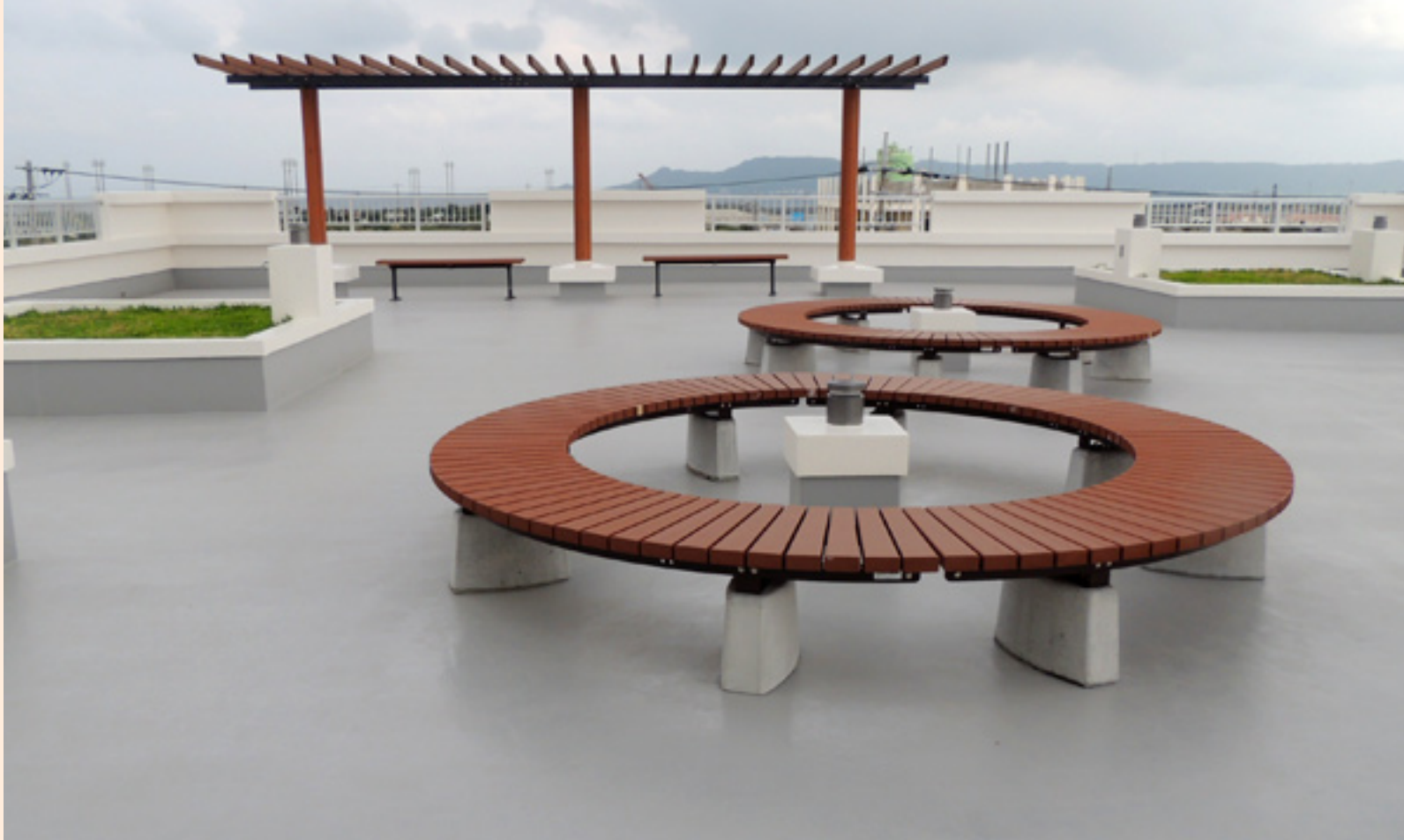
海側にあるテラスの様子。見晴らしもよく、この日、晴れていなかったのが返す返す残念。