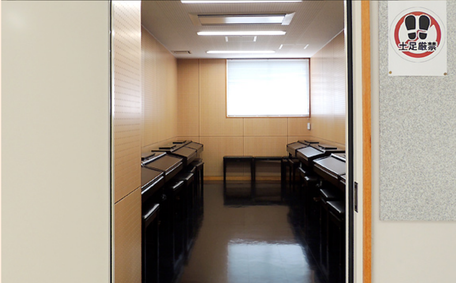
広々としたコンピューター室（写真上）とピアノレッスン室（下）。ピアノは児童教育学科の学生さんが使うようです。

6階の窓から外の光景が見えました。見晴らし最高です！ 晴れていたら、もっともっときれいだったはず。